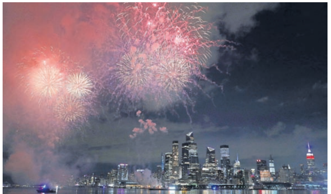
A surprise display of fireworks sponsored by Macy's explode over the Hudson Yards area of Manhattan as seen from a pier in Hoboken, N.J., late Tuesday, June 30, 2020.